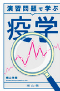
演習問題で学ぶ 疫学 横山 徹爾 南山堂