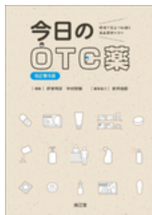
今日のOTC薬 改訂第6版 伊東 明彦 中村 智徳 南江堂