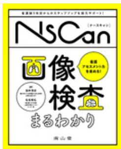
看護アセスメント力を高める！画像検査ま… 酒井 博崇 船曳 知弘 南山堂