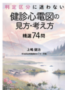
健診心電図の見方・考え方 精選74問 上嶋 健治 南山堂