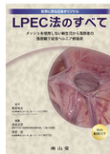
LPEC法のすべて 高原 裕夫（監修） 浦尾 正彦 西原 実 南山堂

*お見積をご希望の場合には下記サイトにて専用アカウントを作成してご依頼ください。 https://customer.isho.jp/