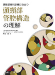
頭頸部管腔構造の理解 西嶋 渡 南山堂