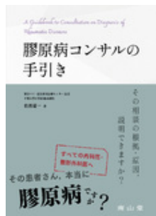
膠原病コンサルの手引き 岩波 慶一 南山堂