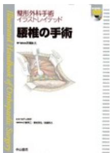
腰椎の手術【動画付き】 高橋 和久 中山書店