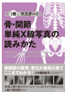
1冊でマスター！ 骨・関節単純X線写… 小橋 由紋子 中外医学社