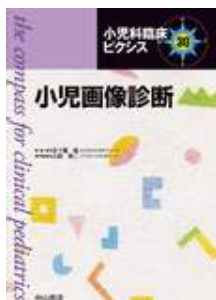
小児画像診断 小熊 栄二 中山書店