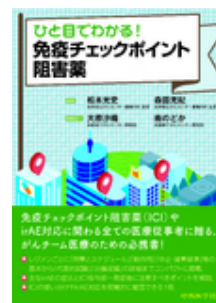
ひと目でわかる！免疫 チェックポイント阻… 松本 光史 森田 充紀 中外医学社

*お見積をご希望の場合には下記サイトにて専用アカウントを作成してご依頼ください。 https://customer.isho.jp/