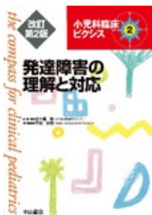
発達障害の理解と対応 改訂第2版 平岩 幹男 中山書店