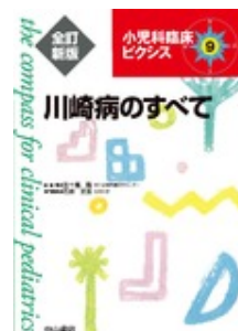
川崎病のすべて 全訂新版 石井 正浩 中山書店