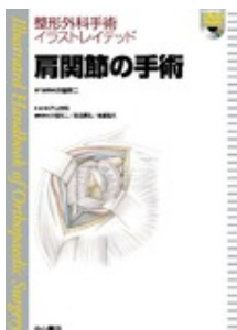
肩関節の手術【動画付き】 井樋 栄二 中山書店