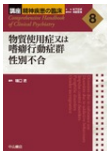
物質使用症又は嗜癖行動症群 性別不合 樋口 進 中山書店