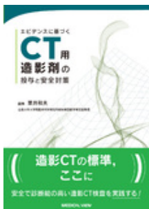
エビデンスに基づく CT用造影剤の投与… 粟井 和夫 メジカルビュー社