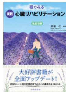
目でみる実践心臓リハ ビリテーション 改… 安達 仁 中外医学社

*お見積をご希望の場合には下記サイトにて専用アカウントを作成してご依頼ください。 https://customer.isho.jp/