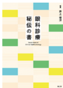
眼科診療 秘伝の書 井上 俊洋 南江堂