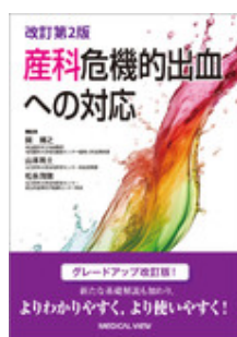
産科危機的出血への対応 改訂第2版 関 博之（編集） 松永 茂剛（編集） 山本 … メジカルビュー社