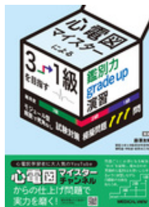
心電図マイスターによ る3→1級を目指す鑑… 藤澤 友輝 メジカルビュー社