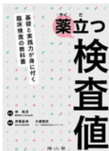
薬立つ検査値 林 松彦（監修） 齊藤 嘉禎 大森 智史 南山堂