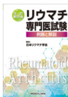
リウマチ専門医試験 改訂第11版 日本リウマチ学会 メジカルビュー社