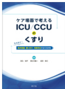
ケア場面で考える ICU/CCUのくすり 茂呂悦子 長谷川隆一 前田幹広 南江堂