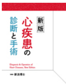
新版 心疾患の診断と手術 新浪 博士 南江堂