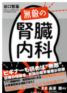
無敵の腎臓内科 谷口 智基 中外医学社