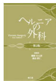
ヘルニアの外科 改訂 第2版 柵瀬 信太郎 諏訪 勝 仁 南江堂